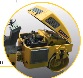
Motor y Transmisión

Las medidas, los pesos y las capacidades mostradas en este folleto, así como cualquier conversión usada, son siempre aproximados y están sujetos a variaciones consideradas normales conforme a las tolerancias de fabricación. ABATI S.A. se reserva el derecho de modificar las especificaciones y los materiales, e introducir mejoras sin previo aviso.