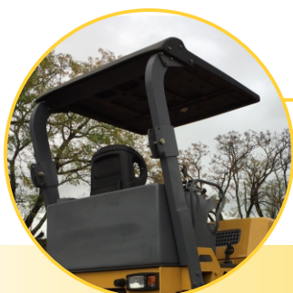
Protección Solar y Barra Antivuelco